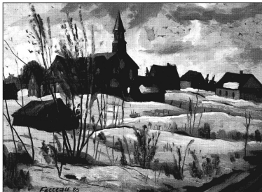
Village sous la neige (huile 12 X 16 — 1985)

Dépôt légal—Bibliothèque nationale du Québec