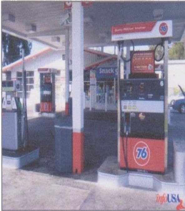
BONNEAU'S TOWING & MECHANICAL - Close-Up