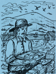
dessin original : E. Chauveau

Ils furent grands pourfant ces paysons hardis Qui, sur ces bords lointains, défièrent jadis L'enfant des bois dans ses repaires, Et perçant la Forêt l'arquebuse à la main, Au progrès à venir ouvrirent le chemin... Et ces hommes furent nos pères !