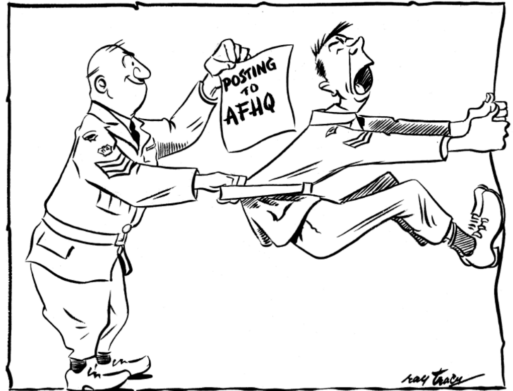
Affectation au GCFA

Sadly, WO I Tracy died at the age of 37.